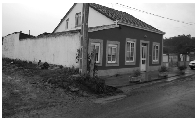
Casa de Rudesindo en Cornido (Narón) onde foi asasinado

Pero Delfina non marchou e viu como varios gardas, irados, se botaron a Sindo, berrándolle: “ ¡Pola túa culpa, cabrón! ”, mentres lle batían na cara cos mosquetóns. Sindo caeu coa cara chea de sangue, e dende o chan chamoulles “covardes”. Daquela levárono a rastro á parte de atrás da casa e Delfina oíu varios disparos. Nunca saberedes cantos nin onde llos deron porque nunca vos deixaron ver o cadaver.